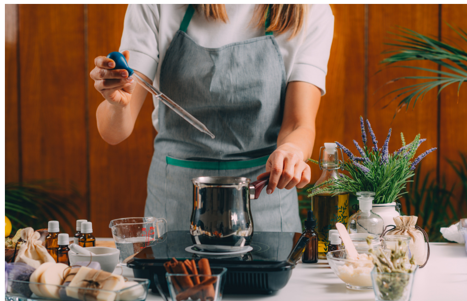
3. Do podgrzanej i roztopionej bazy dodaj ulubiony olejek eteryczny i wybrane dodatki.