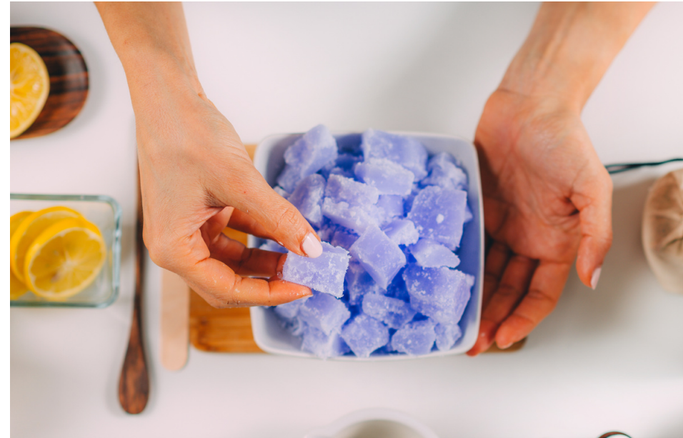
1. Przygotuj bazę mydlaną.