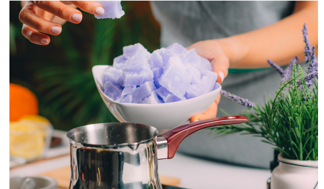
2. Z pomocą opiekuna rozpuść bazę mydlaną w kąpeli wodnej lub małym rondelku.