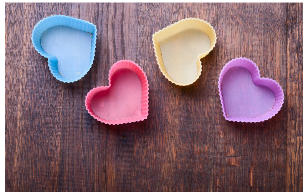
4. Przygotowaną bazę wlej do foremek. Mogą być silikonowe takie jak do pieczenia ciastek lub czekoladek.