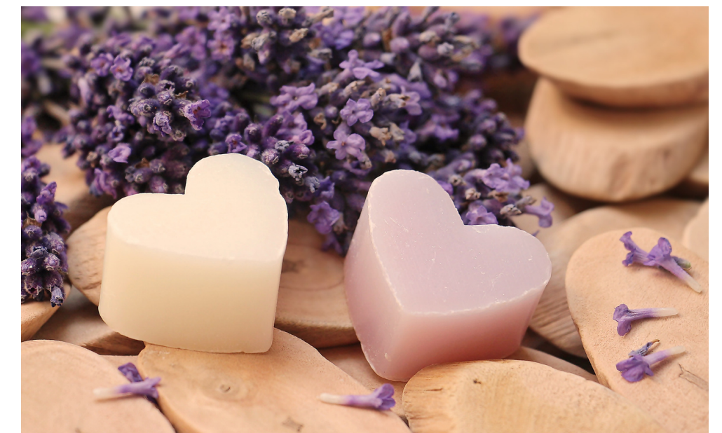
5. Poczekaj aż substancja stężeje. Wyciągnij z foremki. Mydełka gotowe!